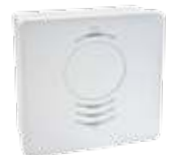
optionaler CO 2 -Sensor AM RF CO2TF