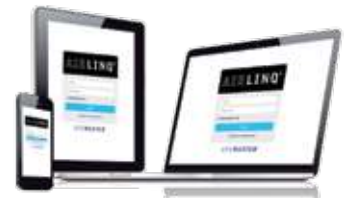
App und Onlineportal Airlinq® Online

Es besteht die Möglichkeit über ein optional erhältliches Online-Modul die Geräte auch nachträglich in ein professionelles Airlinq® Online Webportal einzubinden. Dieses Webportal kommuniziert mit den Geräten über einen Cloud-Dienst. Airlinq® Online ist dafür ausgelegt, Lüftungslösungen für eine oder mehrere Installationen zu steuern, zu überwachen und zu verwalten. Gleich ob mit PC, Tablet oder Smartphone, eine übersichtliche Oberfläche bietet Zugriff auf alle Geräte und deren relevanten Betriebsdaten. Zwischen den mobilen Bedienelementen und Airlinq® Online wird immer eine sichere Verbindung aufgebaut.