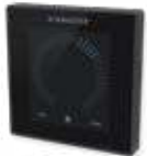
Bedieneinheit AIRLINQ P ORBIT