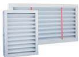
Zuluftfilter ISO ePM1 ≥55% (F7) und Abluftfilter ISO ePM10 ≥70% (M5)