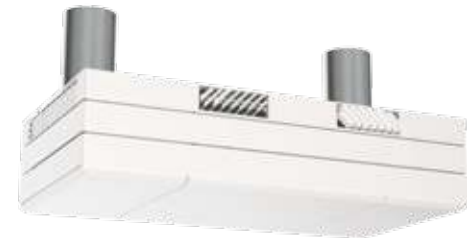
COMFORT-VENT® AMS 1000 Vertikales Modell