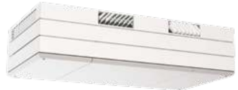
COMFORT-VENT® AMS 1000 Horizontales Modell