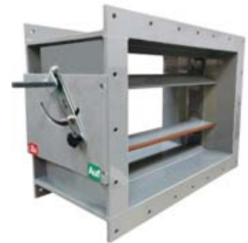
Absperrklappe, gegenläufig (PPs), dicht