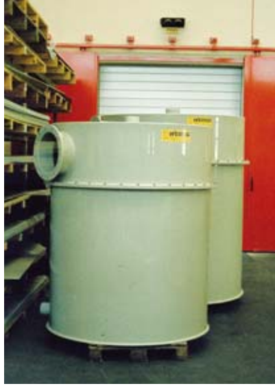
Rundbehälter Ø 1500 (PP)