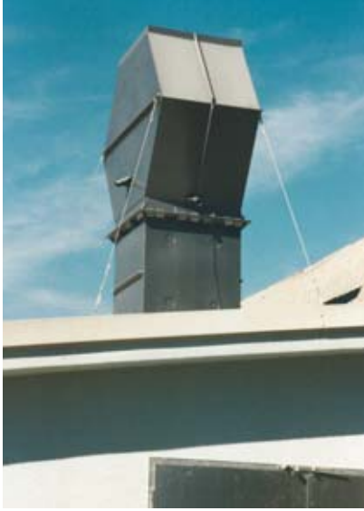
Deflektorhaube eckig 2000 x 1500 (PVC)