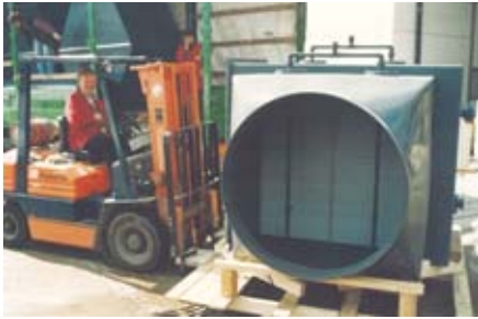
Tropfenabscheider (PVC) bis 100.000 m 3 /h