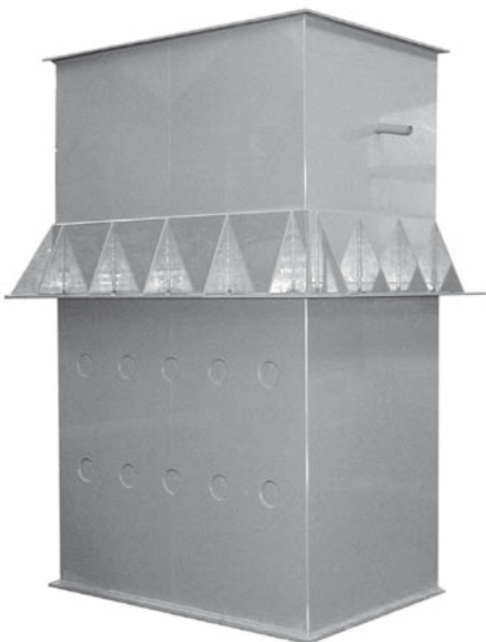
Schalldämpfer mit integriertem Deflektor 1600 x 1000 (PPs)