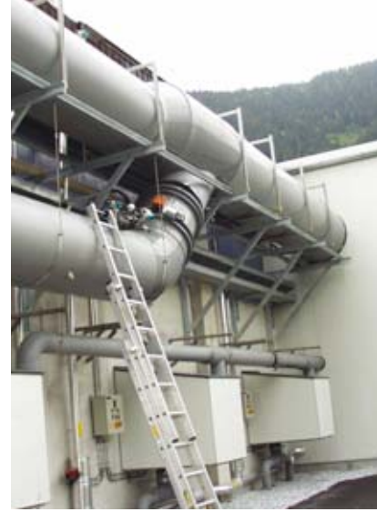
Industrierohrleitung Ø 1200 (PPs)