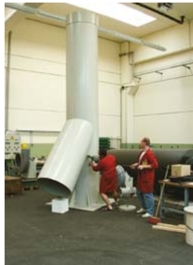
Abluftkamin Ø 900 (PP)