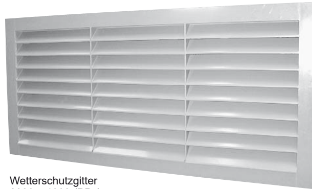
Wetterschutzgitter 2300 x 1000 (PPs)