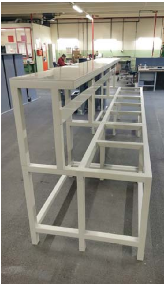
Regal - säurefest (PP)