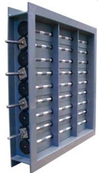
Jalousieklappe, gegenläufig (PPs)