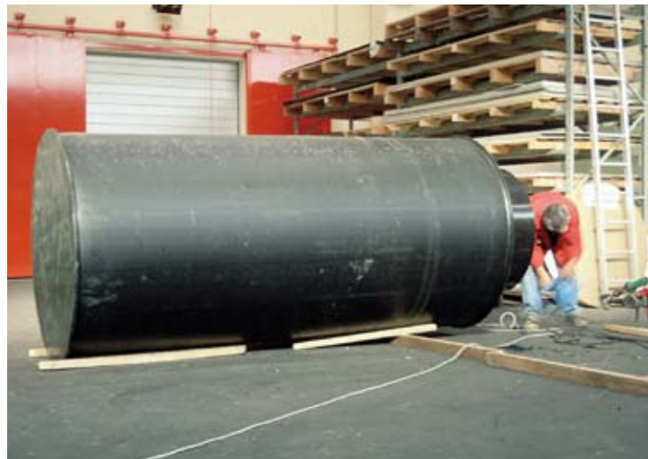
3-Kammerkläranlage Ø 1400 (PE)