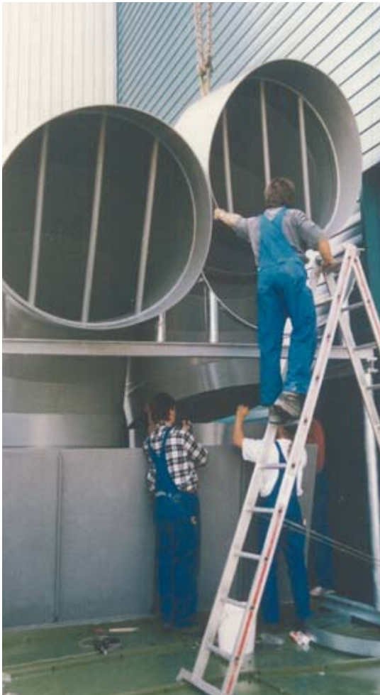
Ausblasebögen Ø 1250 (PPs)