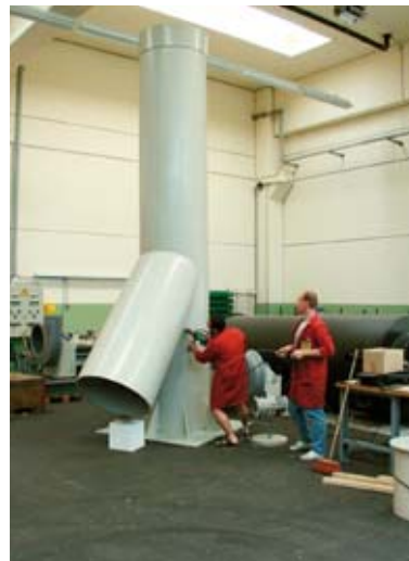
Abluftkamin Ø 900 (PP)