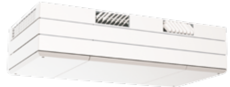
COMFORT-VENT® AM 1000 Horizontales Modell

Prinzipiell sind die Lüftungsgeräte in zwei Ausführungsvarianten lieferbar: Als Horizontalmodell mit Fort- und Außenluftanschluss auf der Rückseite des Gerätes zur direkten Durchführung durch eine Wand und als Vertikalmodell mit Fort- und Außenluftanschluss auf der Oberseite des Gerätes zur Durchführung durch die Raumdecke über Dach. Beide Varianten sind zusätzlich noch als teilintegrierte Ausführung lieferbar, d. h. 1/3 oder 2/3 des Gerätes befinden sich in der Zwischendecke. Regelungstechnisch stehen auch zwei Ausführungen mit umfangreichen Steuerungsmöglichkeiten und Zusatzkomponenten für die jeweiligen Anforderungen zur Verfügung. Weiters sind folgende Optionen möglich: Kühlmodul, Vorheiz- oder Nachheizregister, CO 2 -Sensoren und Netzwerkmodule für eine Buseinbindung. Detaillierte Informationen über mechanische und regelungstechnische Ausführung sowie weiteres Zubehör und Gerätezeichnungen finden sie im ausführlichen Planungshandbuch AM 100 – 1000 oder den Gerätezeichnungen AM 100 – 1000 auf www.wernig.at Produktpalette Register 4.