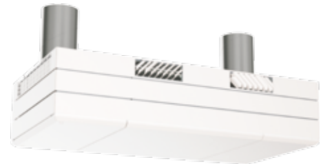
COMFORT-VENT® AM 1000 Vertikales Modell