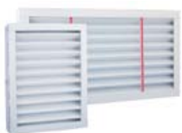
Zuluftfilter F7 und Abluftfilter M5