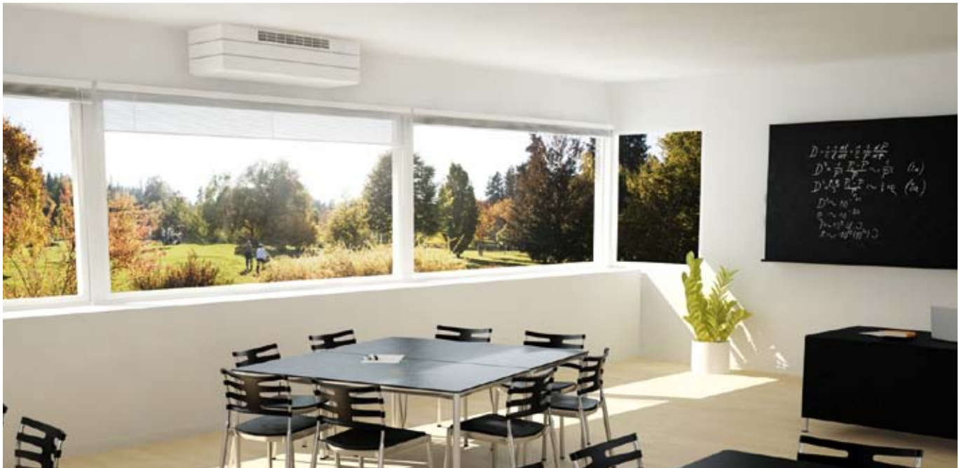
Einbaubeispiel AM 800