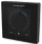
Bedieneinheit AIRLINQ P