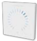
Bedieneinheit AIRLINQ L