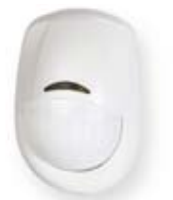
optionaler Bewegungssensor AM PIR