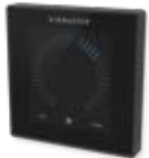
Bedieneinheit AIRLINQ P