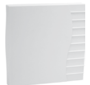
optionaler CO 2 -Sensor AM RF CO2TF