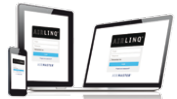
App und Onlineportal Airlinq® Online

Es besteht die Möglichkeit über ein optional erhältliches Online-Modul die Geräte auch nachträglich in ein professionelles Airlinq® Online Webportal einzubinden. Dieses Webportal kommuniziert mit den Geräten über einen Cloud-Dienst. Airlinq® Online ist dafür ausgelegt, Lüftungslösungen für eine oder mehrere Installationen zu steuern, zu überwachen und zu verwalten. Gleich ob mit PC, Tablet oder Smartphone, eine übersichtliche Oberfläche bietet Zugriff auf alle Geräte und deren relevanten Betriebsdaten. Zwischen den mobilen Bedienelementen und Airlinq® Online wird immer eine sichere Verbindung aufgebaut.