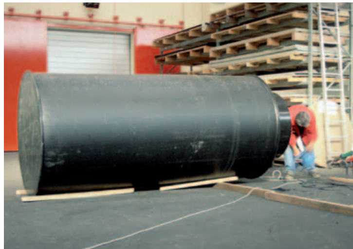
3-Kammerkläranlage Ø 1400 (PE)