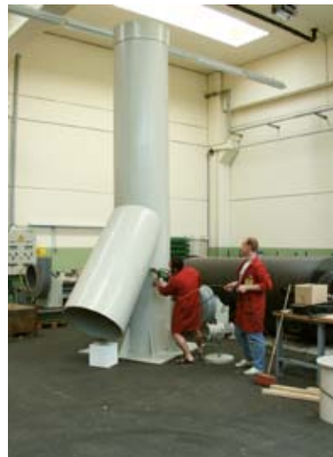
Abluftkamin Ø 900 (PP)