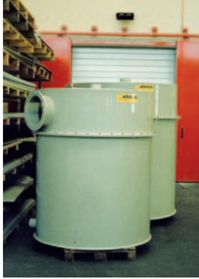
Rundbehälter Ø 1500 (PP)