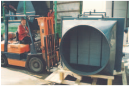
Tropfenabscheider (PVC) bis 100.000 m 3 /h