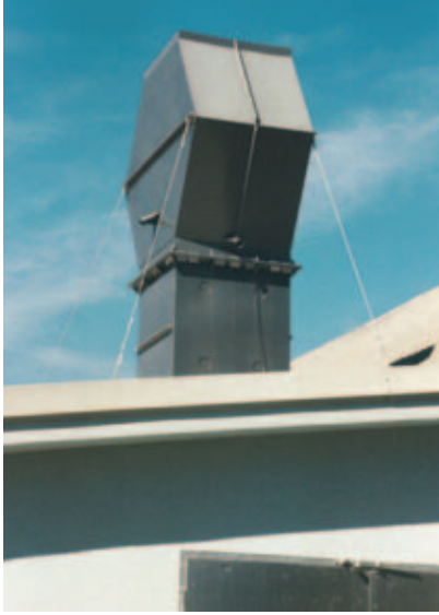
Deflektorhaube eckig 2000 x 1500 (PVC)