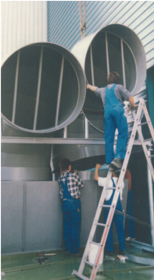
Ausblasebögen Ø 1250 (PPs)