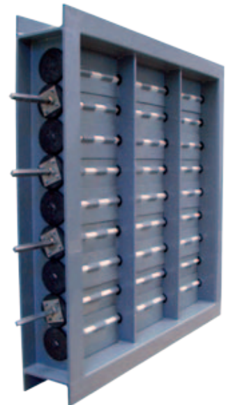
Jalousieklappe, gegenläufig (PPs)