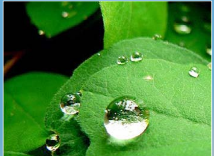
Feuchterückgewinnung nach dem Osmoseprinzip – lieferbar für Geräteserien G 90-160, G 90-200, G 90-380 und G 90-550